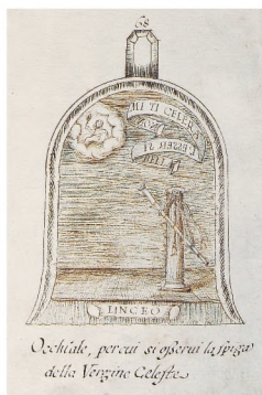
Disegnato per cui si aggora la figura della Vergine Celestis

■ Disegno a penna della pala di Galileo, in Raccolta d'imprese degli Accademici della Crusca MDCLXXXIV (1684-1690) .